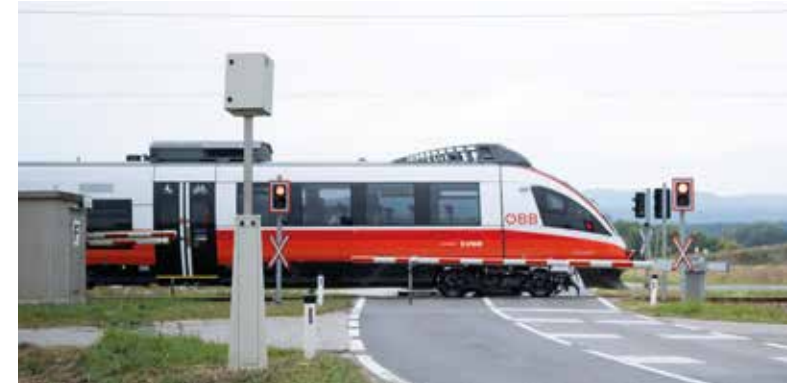
An Eisenbahnkreuzungen kommt es besonders häufig zu Rotlichtübertretungen. Das gilt sogar für beschränkte Bahnübergänge ...

Das „Überfahren“ einer roten Ampel ist kein „Kavaliersdelikt“. Zusätzlich zu einem Bußgeld kann es zu einer Vormerkung im österreichischen Führerscheinregister kommen, wenn andere Verkehrsteilnehmer gefährdet wurden. Bei zwei Vormerkungen innerhalb von zwei Jahren ist eine Maßnahme (z. B. eine Schulung) zwingend. Bei drei Vormerkungen ist der „Schein“ vorübergehend weg – die Lenkberechtigung wird für mindestens drei Monate entzogen.