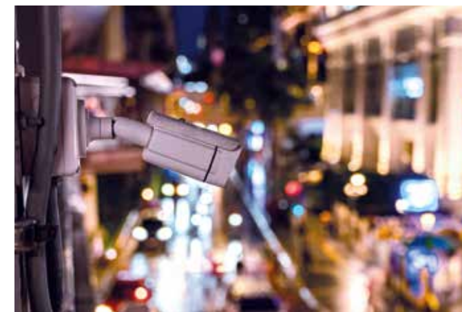
Automatisierte Zufahrtskontrolle für Fußgänger- und Begegnungszonen – der Gesetzgeber sieht Grenzen vor und achtet auf den Datenschutz.

Die hier eingesetzten Kameras unterscheiden sich deutlich von herkömmlichen „Consumer-Kameras“. Und selbst Kennzeichen-Erkennung ist nicht gleich Kennzeichen-Erkennung. Abgesehen vom Datenschutz, den entsprechend ausgeklügelten Software-Lösungen und den Anforderungen des öffentlichen Raums sind die Einzelkomponenten hier auf Dauerbetrieb ausgelegt – nicht nur für eine kurze Momentaufnahme. Das verlangt nach einer anspruchsvollen Hardware. Dazu kommen Anforderungen hinsichtlich Wetter, Gegenlicht, Nachtbetrieb, Eindeutigkeit und Nachvollziehbarkeit. Das erfüllen nur speziell für diese Anwendung ausgelegte Kamerasysteme in Kombination mit einer hochentwickelten Software. EBE Road bietet die passenden technischen Lösungen aus einer Hand – Know-how zu den rechtlichen Rahmenbedingungen und Begleitung des Gesamtprozesses inklusive. Unsere Experten beraten Sie gerne. 📞