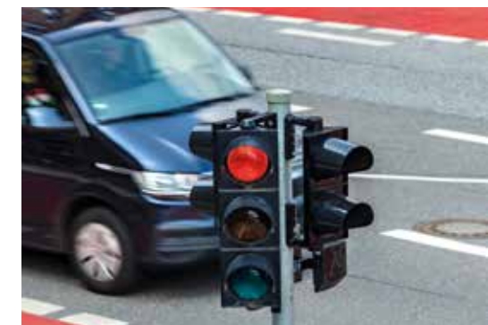
Rotlicht-Überwachungssysteme sorgen für Achtsamkeit – deutlich weniger Lenker versuchen sich „drüberzuschwindeln“.

➔ Für die zuverlässige Funktion einer Anlage zur Rotlichtüberwachung ist die zum Einsatz kommende Sensortechnik entscheidend. Worauf es dabei ankommt, das erfahren Sie in unserem Bericht zur Forschung und Entwicklung bei Rotlichtsensoren auf Seite 7.